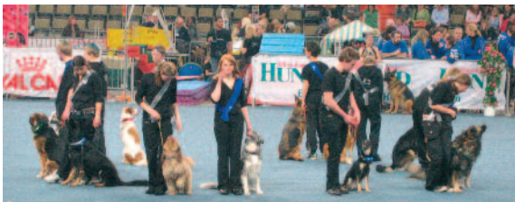
Auftritt der Jugendgruppe „Hunde bauen Brücken“ bei der Internationalen Hundeausstellung in München

Diese positiven Erfahrungen sollen möglichst vielen Kindern und Jugendlichen zugänglich gemacht werden durch